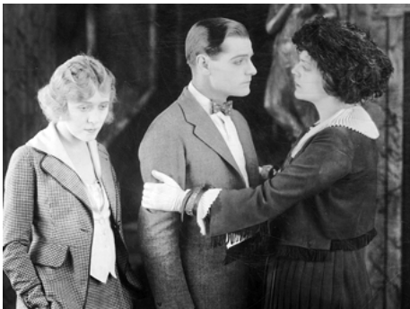
1918 MISS MAC CHESNEY (Our Mrs McChesney) de Ralph Ince avec Lucille Lee Stewart, W. Lytell