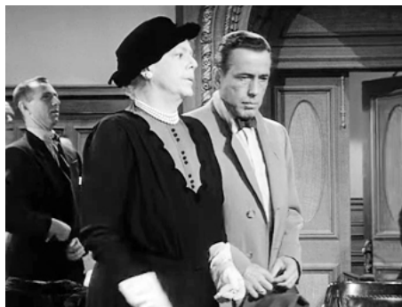
1952 BAS LES MASQUES (Deadline USA) de Richard Brooks avec Humphrey Bogart