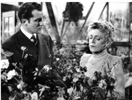
1946 LA ROSE DU CRIME (Moss Rose) de Gregory Ratoff avec Vincent Price