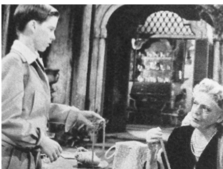
1953 HISTOIRE DE TROIS AMOURS (The Story of three loves) de V. Minnelli avec Ricky Nelson