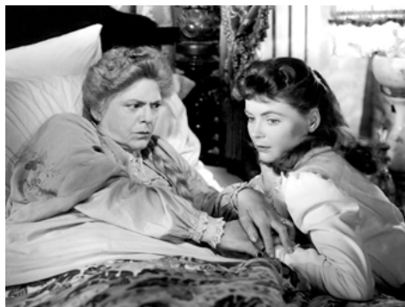
1945 DEUX MAINS DANS LA NUIT (The Spirale Staircase) de Robert Siodmak avec Dorothy McGuire