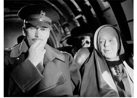
1949 LE DANUBE ROUGE (The Red Danube) de George Sidney avec Walter Pidgeon