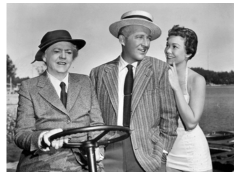
1952 POUR VOUS MON AMOUR (Just for You) d'Elliott Nugent avec Bing Crosby, Jane Wyman