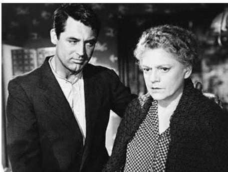
1944 RIEN QU'UN CŒUR SOLITAIRE (None but the lonely heart) de Clifford Odets avec Cary Grant