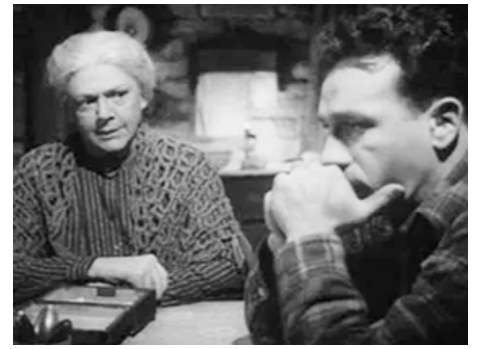
1948 LE FILS DU PENDU (Moonrise) de Frank Borzage avec Dane Clark