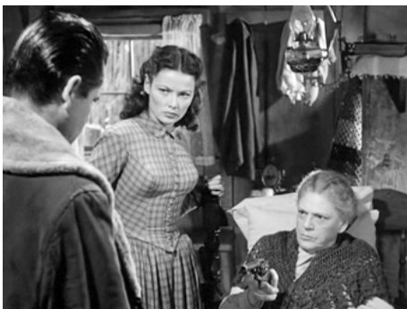
1951 L'ÉNIGME DU LAC NOIR (The Secret of Convict Lake) de M. Gordon avec Glenn Ford, Gene Tierney