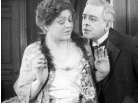
1916 LE CORBEAU BLANC (The White Raven) de George D. Baker avec William B Davidson