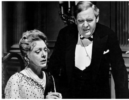
1947 LE PROCÈS PARADINE (The Paradine Case) d'Alfred Hitchcock avec Charles Laughton