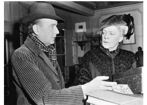
1951 FEMME EN PÉRIL (Kind Lady) de John Sturges avec Maurice Evans