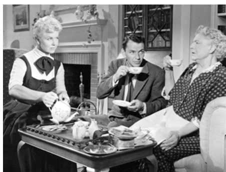
1954 UN AMOUR PAS COMME LES AUTRES (Young at heart) de G. Douglas avec Doris Day, Frank Sinatra