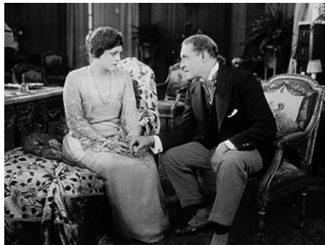
1920 LA DIVORCÉE d'Herbert Blaché avec Holmes Herbert