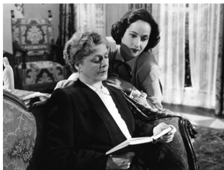
1947 ROMANCE D'UNE NUIT (Night Song) de John Cromwell avec Merle Oberon