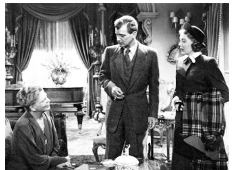
1946 MA FEMME EST UN GRAND HOMME (The Farmer's Daughter) de H. C. Potter avec J. Cotten, Loretta Young