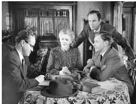
1950 IT'S A BIG COUNTRY de John Sturges avec Bill Welsh, Keenan Wynn, George Murphy