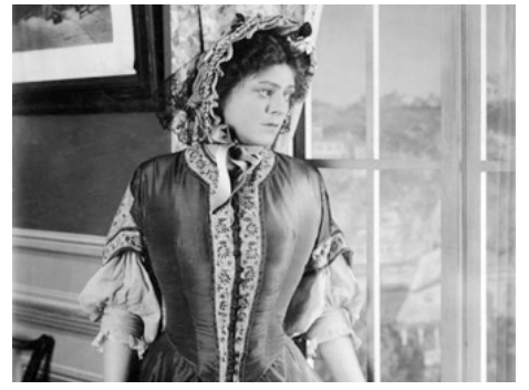
1915 THE AWAKENING OF HELENA RITCHIE de John H. Noble