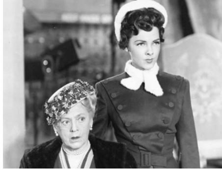
1949 LE BAISER DE MINUIT (The Midnight Kiss) de Norman Taurog avec Kathryn Grayson