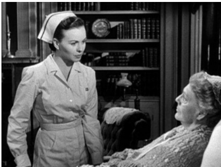
1949 L'HÉRITAGE DE LA CHAIR (Pinky) d'Elia Kazan avec Jeanne Crain