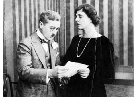
1918 AN AMERICAN WIDOW de Frank Reicher avec Irving Cummings