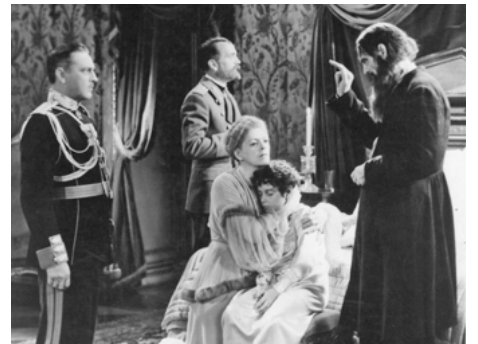
1932 RASPOUTINE ET L'IMPÉRATRICE (Rasputin and the empress) de R. Boleslawsky avec John et Lionel Barrymore