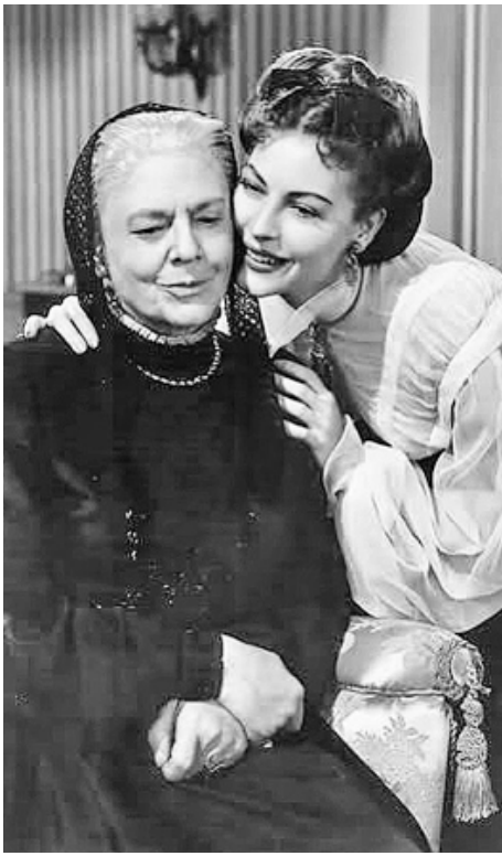
1948 PASSION FATALE (The great Sinner) de Robert Siodmak avec Ava Gardner