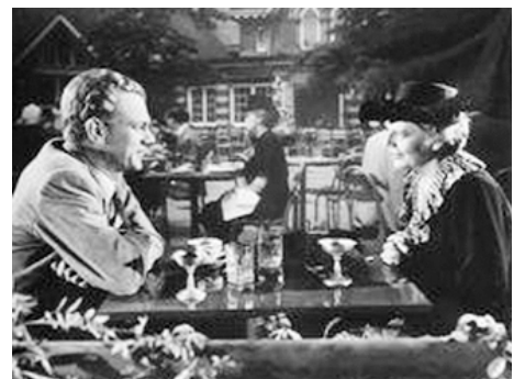
1947 LE PORTRAIT DE JENNY (The Portrait of Jennie) de William Dieterle avec Joseph Cotten